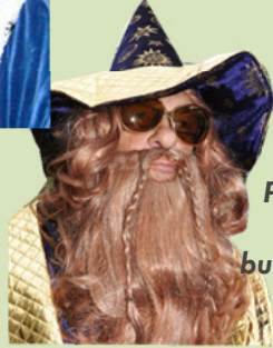
Koningin van Pekela, Hare Majesteit